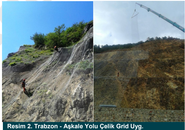
Resim 2. Trabzon - Aşkale Yolu Çelik Grid Uyg.