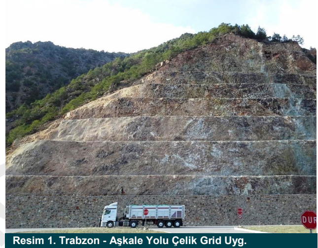
Resim 1. Trabzon - Aşkale Yolu Çelik Grid Uyg.